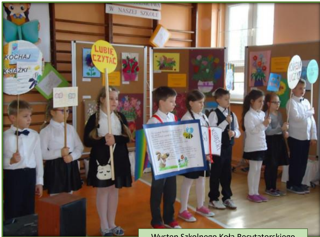
Występ Szkolnego Koła Recytatorskiego