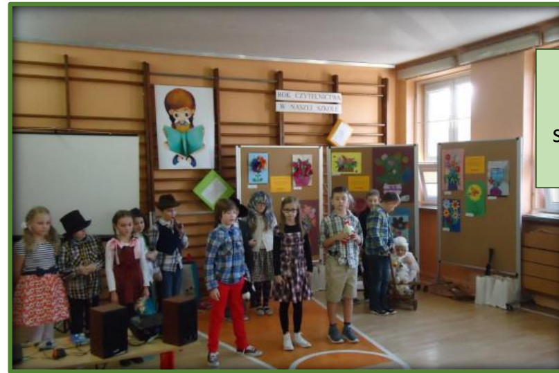
Klasy prezentują swoje ulubione książki.